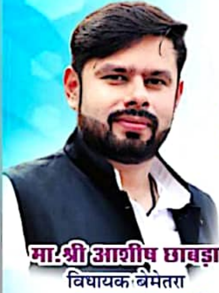
मा.श्री आशीष चावड़ा विधायक बेमेतरा