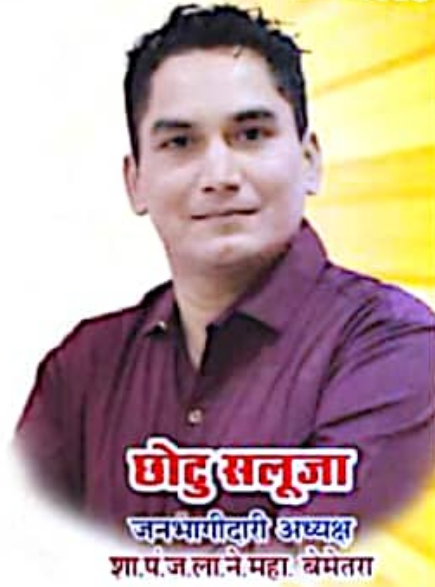
श्री सुकु सुकु जनभागीदारी अध्यक्ष शा.पं.ज.ला.ने.महा. बेमेतरा